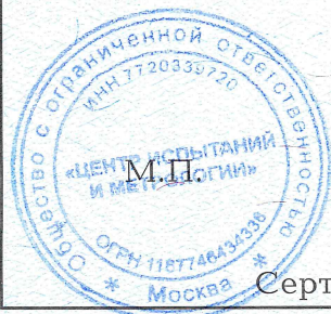
Схема сертификации: 3с.